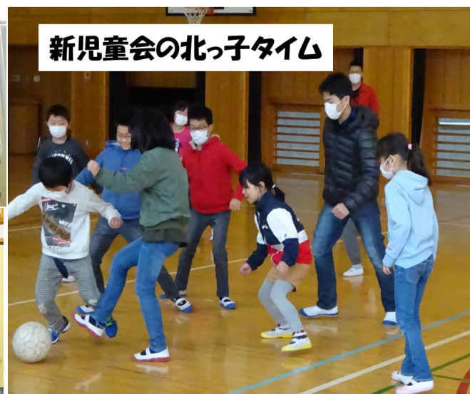
新児童会の北っ子タイム